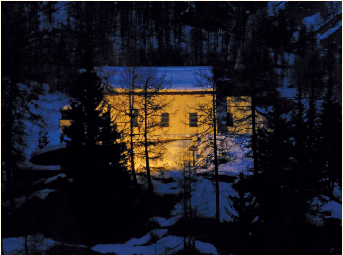
St. Antonius Kapelle, Münster, Foto: Gabriela Hischier, Oberwald

Oberwald – Obergesteln – Ulrichen Münster – Reckingen – Gluringen Biel – Blitzingen – Niederwald