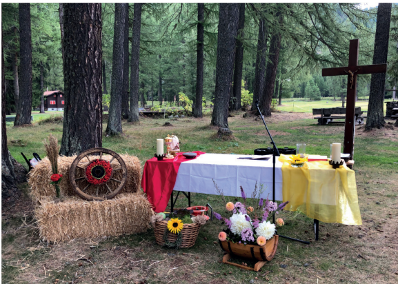
Erntedank-Altar im Pischewald

Allen Frauen, Männern und Kinder, die zu einem guten Gelingen dieses Festes beigetragen haben, sei an dieser Stelle ganz herzlich gedankt. Vergelt's Gott!