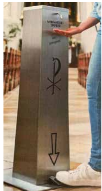
Bild: Weihwasserverteiler in einer Pfarrkirche. Bekreuzigung mit Weihwasser ist für Gläubige Zeichen des Glaubens