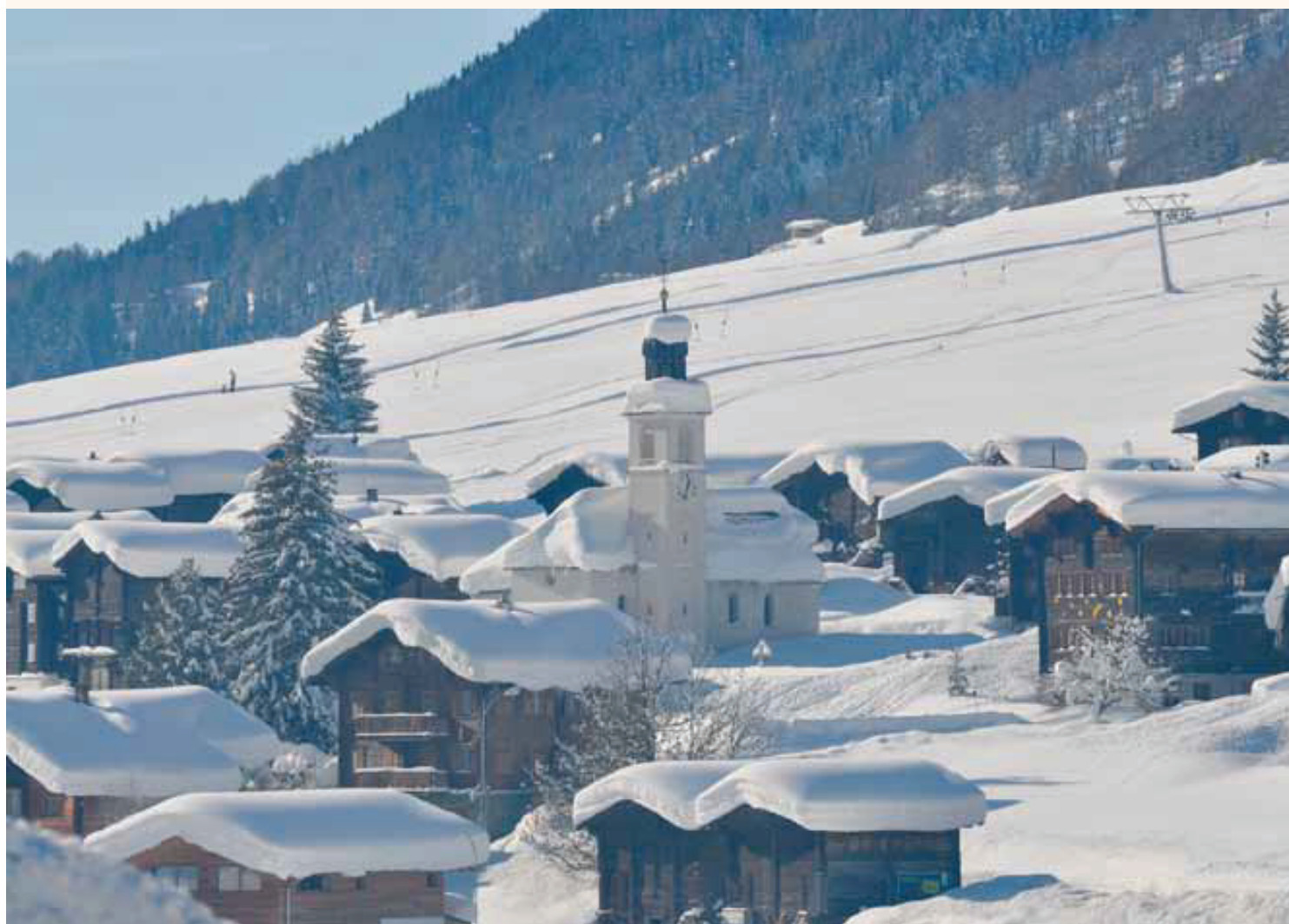
Kirche Gluringen

Oberwald – Obergesteln – Ulrichen Münster – Reckingen – Gluringen Biel – Blitzingen – Niederwald