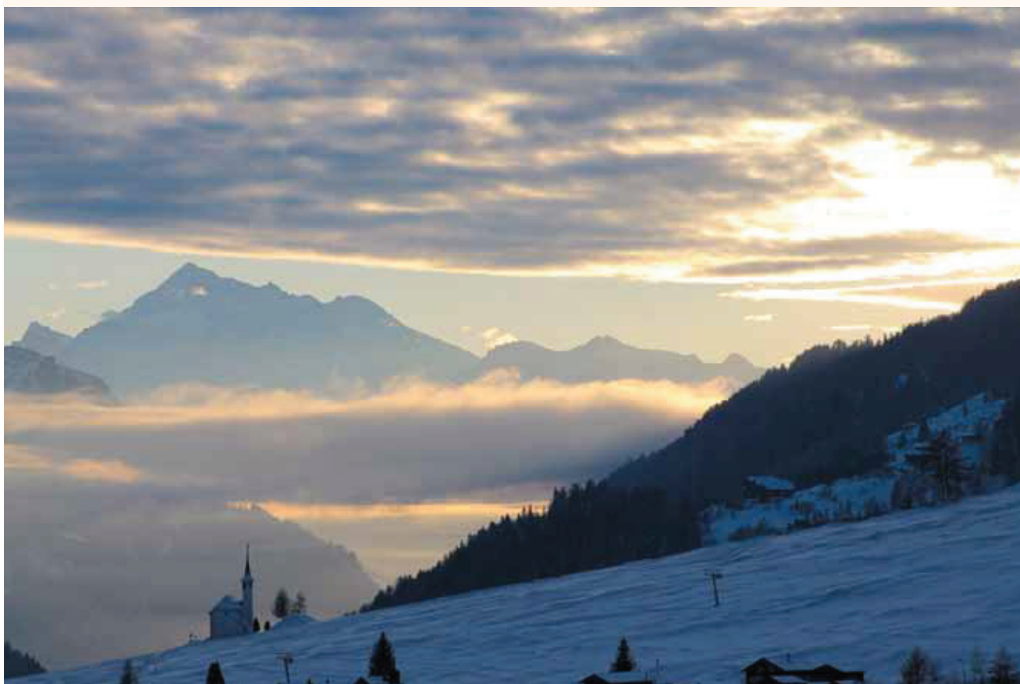
Ritzinger Feldkapelle

Oberwald – Obergesteln – Ulrichen Münster – Reckingen – Gluringen Biel – Blitzingen – Niederwald