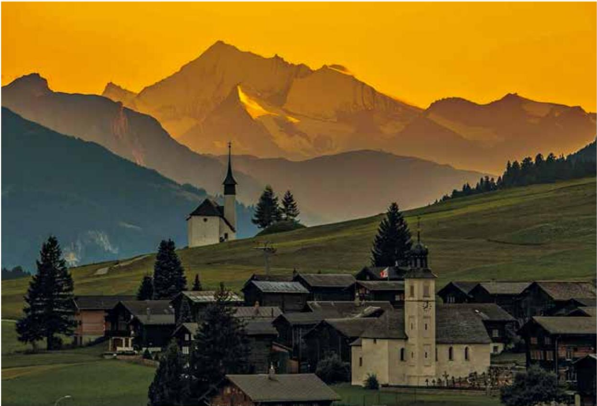
Gluringen / Ritzingerfeld