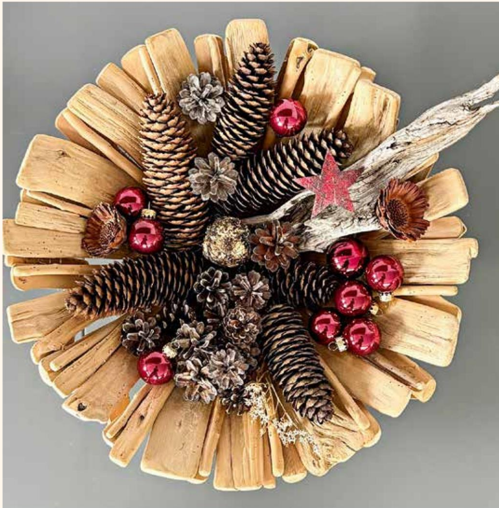
Das Jahr nimmt seinen Anfang