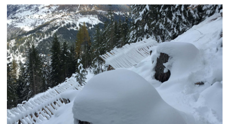
Schutzmassnahmen wurden in verschiedenen Öffnungen im Wald entlang des Leitungstrassees gebaut.