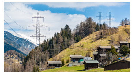
Die alte Leitung wie hier in Steinhaus wird demontiert.