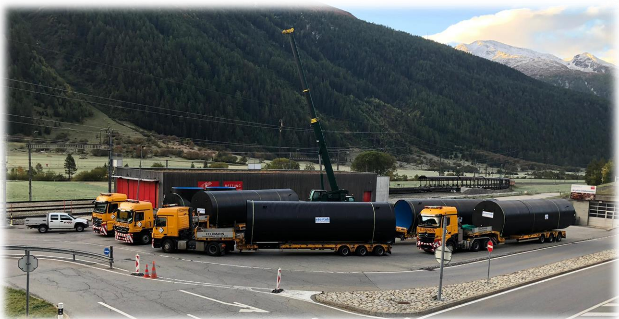
Anlieferung der Fertigelemente auf dem Bahnhof in Oberwald

Walpen AG, Visp Etertub AG, Bilten Endress+Hauser, Reinach Hallenbarter & Russi AG, Obergesteln Forst Goms, Reckingen Werner Elektro AG, Brig Baumarep AG, Brig