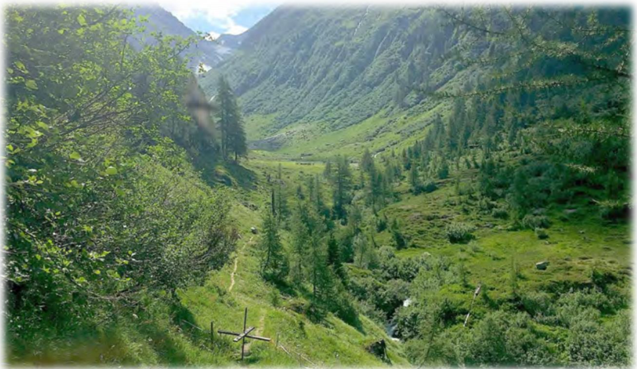
Blick ins Gonerli

Das Departement für Volkswirtschaft und Bildung hat im Mai 2020 das Projekt genehmigt und die Dienststelle für Landwirtschaft (Amt für Strukturverbesserungen) mit der Umsetzung des Beschlusses betraut. Aufgrund der eingeholten Offerten wurden Gesamtkosten von CHF 150'000.- budgetiert.